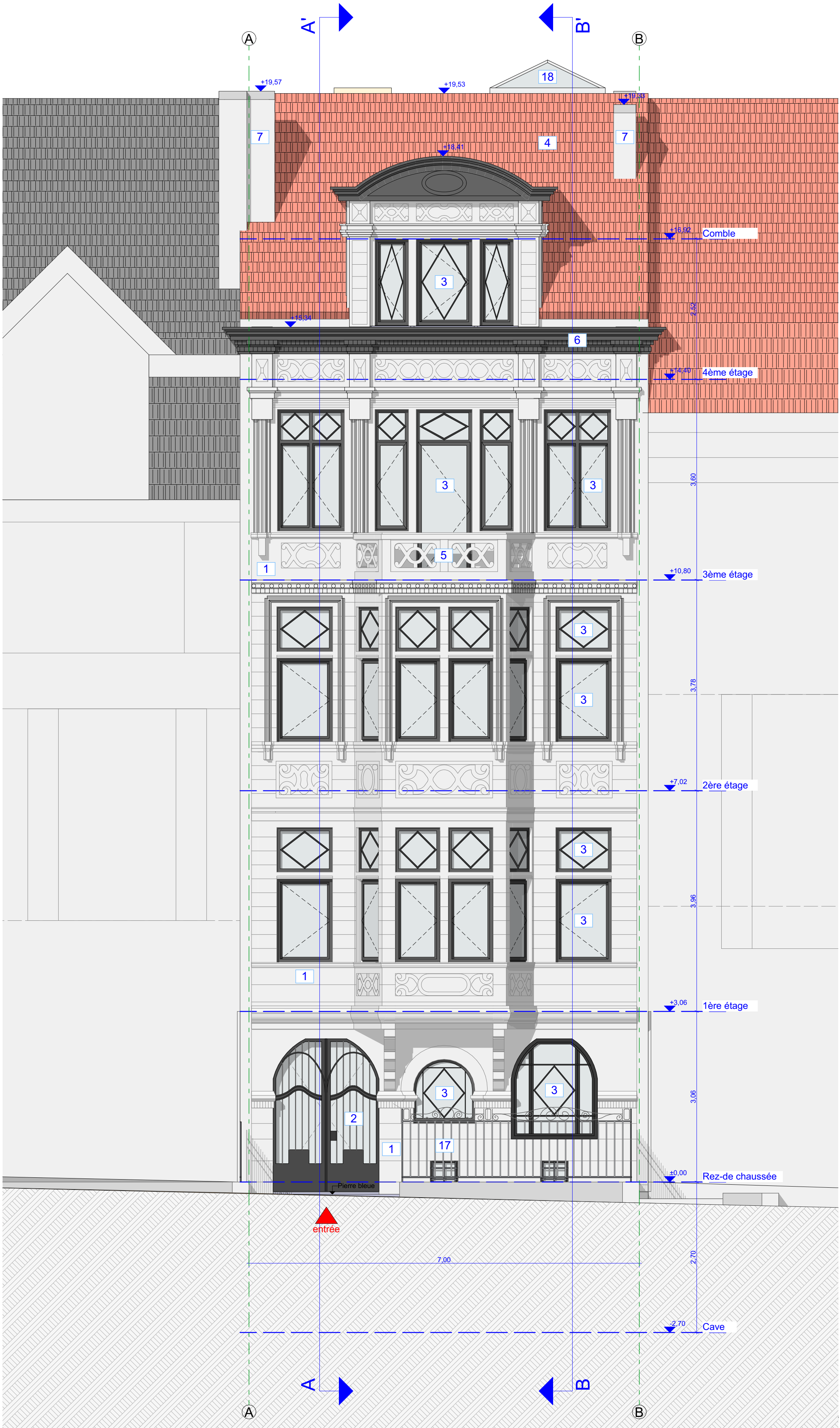
Façade à rue SITUATION DE FAIT 1:50